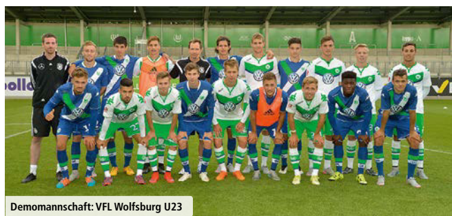
Demomannschaft: VFL Wolfsburg U23