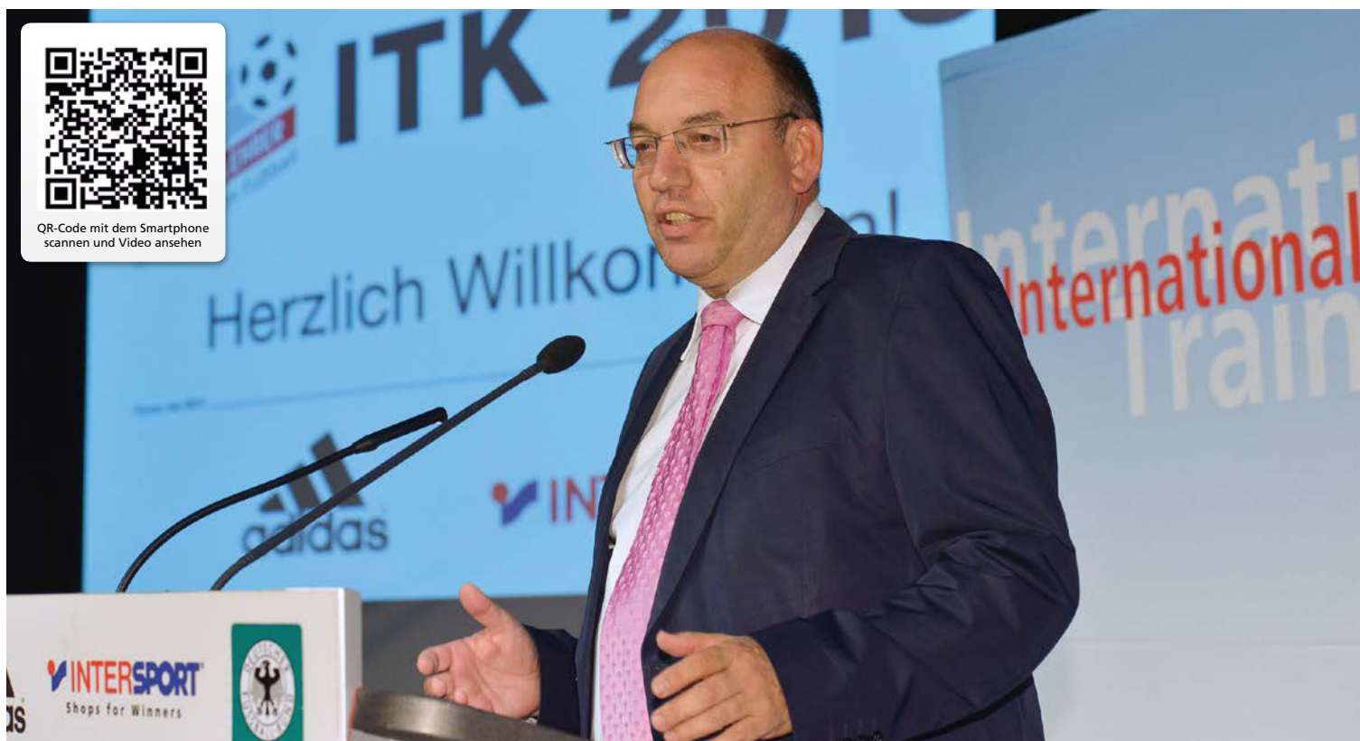
Manfred Schaub | 1. Vize-Präsident des BDFL