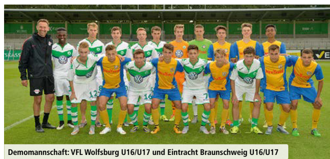
Demomannschaft: VFL Wolfsburg U16/U17 und Eintracht Braunschweig U16/U17